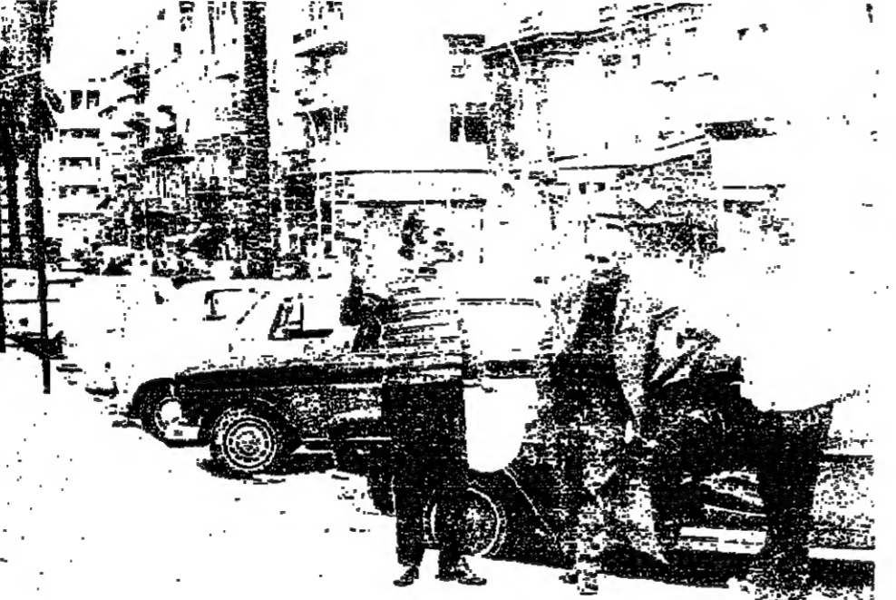
موقف سيارات حمانا عاد الساحة البرج